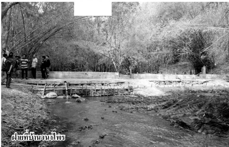
ฝายที่บ้านนาไพร

“ตอนที่ผมเป็นผู้ใหญ่บ้านผมได้บอกให้ชาวบ้านออกมาจากป่าตั้งนานแล้ว เพราะถ้ายังทำกินในป่าจะถูกจับ ซึ่งก็มีหลายคนถูกจับและเสียเงินไปเป็นแสน ตอนนั้นเมื่อมี