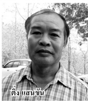
ดิ้ง แสนขัน

ปลูกข้าวโพดเลี้ยงสัตว์ โดยใช้เวลา 4 เดือนเท่านั้นในฤดูฝนประมาณเดือนพ.ค.ถึงส.ค. วางอยู่ 8 เดือนแต่พอมาเข้าโครงการสามารถมีความมั่นคงทางอาหารได้ทั้งปี โดยไม่ต้องซื้อหา ปลูกพืชผักสวนครัว และมีรายได้เพิ่มขึ้น ซึ่ง ดร.วิวัฒน์ ศัลยกำธร หรือ อาจารย์ยักษ์ รัฐมนตรีช่วยว่าการกระทรวงเกษตรและสหกรณ์ เคยเข้ามาเยี่ยมชมเกษตรกรกลุ่มนี้ในพื้นที่แล้ว พร้อมชื่นชมและให้กำลังใจ