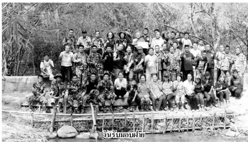
วันรับมอบผืนป่า